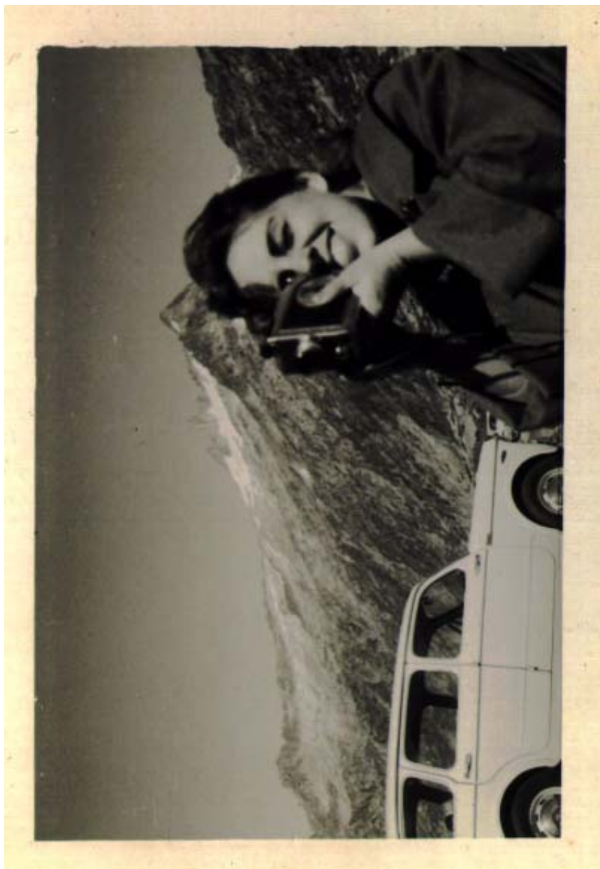
Ei-la borbolha, borboleta sumariíssima.